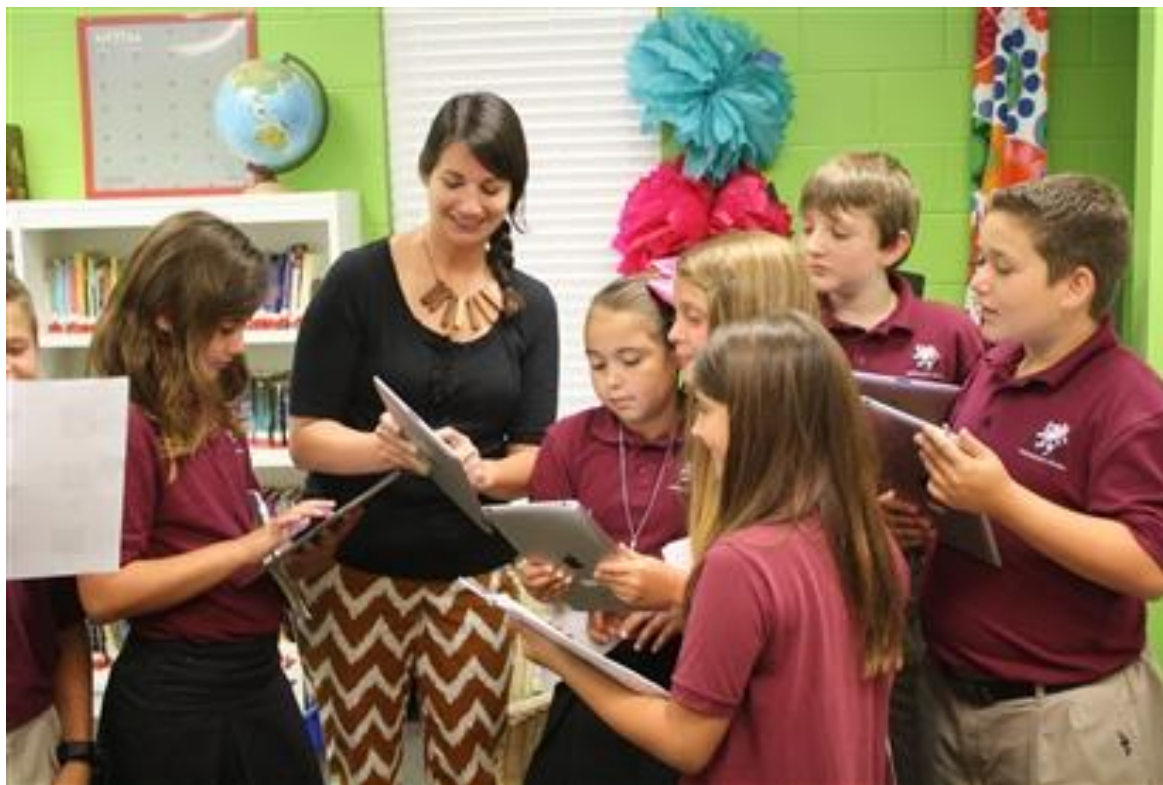
本资料由美国 FLS 教育集团收集整理